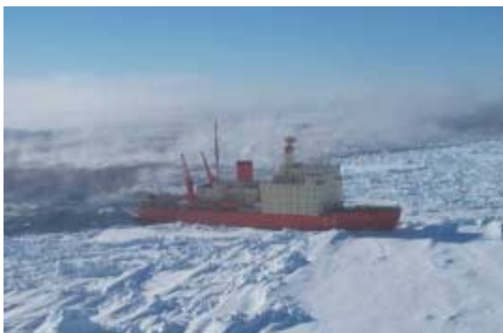
Figura 1. El rompehielos A.R.A. "Alte. Irizar" operando en la Antártida

El equipo del IAA tendrá la responsabilidad del estudio de la diversidad de regímenes tróficos en la región, que es una de las zonas más ricas del mundo en fitoplancton calcáreo, con dominio de fitoplancton silicio, éste último particularmente al sur del Frente Polar. Esto permitirá cuantificar y comparar la eficacia de cada uno de los regímenes tróficos con relación al transporte de CO 2 mar- atmósfera.